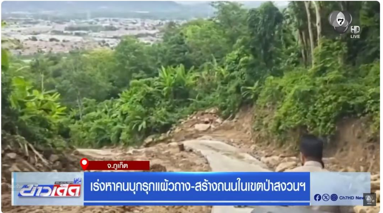
เร่ร่อนคนบุกรุกแผ้วถาง-สร้างถนนในเขตป่าสงวนฯ | ข่าวเด็ด 7 สี