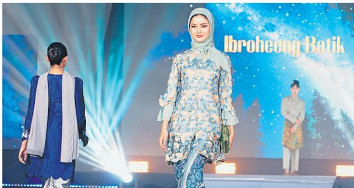
ผ้าท้องถิ่นมลายู เทศกาลนครยะลา เปิดรันเวย์เดินแบบแฟชั่นโชว์สวยงาม สุดอลังการ “Pakaian Melayu Fashion Show 2026” ส่งเสริมอนุรักษ์ผ้าท้องถิ่นมลายู.

หัวข้อข่าว: สัมผัสวัฒนธรรม-กีฬา-ท่องเที่ยววิถีถิ่นไทย