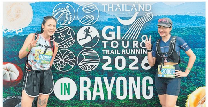
ปลุกกระแส นักวิ่งสาวถ่ายภาพกับแบ็กกรรอปงาน “Amazing Thailand GI Tour & Trail Running 2026” ที่โรบินสันไลฟ์สไตล์ บ้านฉาง จ.ระยอง.