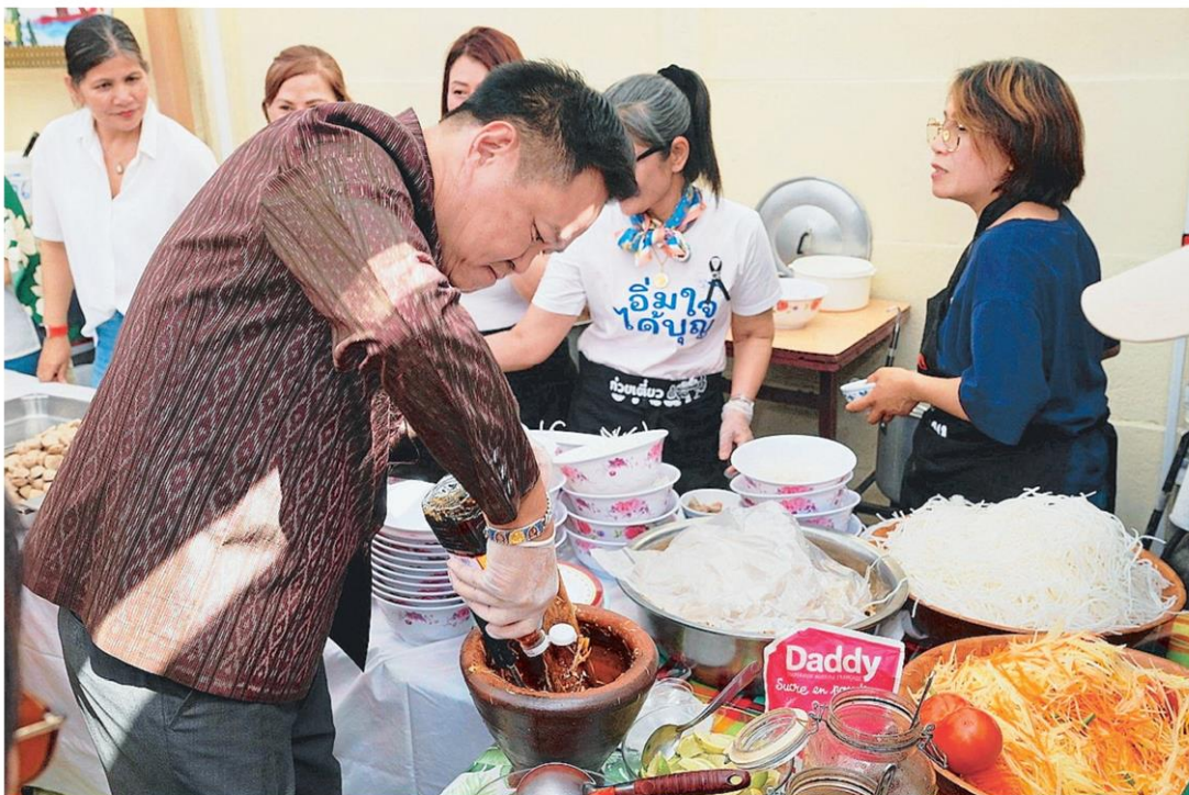
โชว์ลีลาตำ นายอนุทิน ชาญวีรกูล นายกฯและ รวม.มหาดไทย โชว์ลีลา ตำส้มตำระหว่างพบปะชุมชนชาวไทย ที่ วัดพุทธนานาชาติ กรุงปารีส สาธารณรัฐ ฝรั่งเศส หลังเป็นประธานในพิธีสวด พระพุทธมนต์และพิธีทำบุญตักบาตร ถวายพระราชกุศล สมเด็จพระนางเจ้า จำเริญพรหมมาศจี พระบรมราชินี.

คลังยันเป่าตั้ง ☆ ต่อจากหน้า 1 “ภูมิปัญญาวัฒนธรรม” โชว์ลีลาตำส้มตำพชมชน ชาวไทยในปารีสคลังโอ “แอปเป่าตั้ง” ไม่มีล้มพร้อม รับลงทะเบียน “เอกนิติ” ตั้ง 8 อนุฯลุยแดนดื่บบริดจ์ “มาร์ค” ชำแหละผลาญเงินฯ ล้านล้าน ชงโมเดล ปป.พัฒนาภาคได้ประกบจะ ก.พลังงานลดค่าการ ถลำตีเพี้ย กระตุก “คนคิดกินรวบประเทศ” จบไม่สวย “ชนมพัตมฐ์” ระทึก ดีเอสไอขอ อป.สภางคเอกสิทธิ นำตัวไปสอบคดี “พนนออนไลน์” ฐานอั้งยี่-เอี่ยว อาชญากรรมข้ามชาติ “แท่ง” ย้ำสภาฯไม่ควรปกป้อง คนผิดเลขาฯมท. ชงป.ช.ฟัน “ภูมิธรรม-ปลัด มท.” ภารกิจการเยือนสาธารณรัฐฝรั่งเศส นายอนุทิน ชาญวีรกูล นายกฯและ รวม.มหาดไทยเดินสายพบ หารือ ผอ.ทบวงการพลังงานระหว่างประเทศ ขอรับ การสนับสนุนไทยเข้าเป็นสมาชิก OECD และผอ.ใหญ่ UNESCO ผลักดันชุดไทย คู่มรดกภูมิปัญญาทาง วัฒนธรรมของมนุษยชาติ