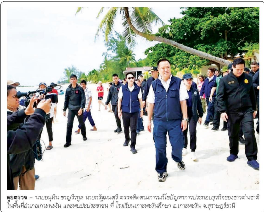
ลุยตรวจ - นายอนุทิน ชาญวีรกูล นายกรัฐมนตรี ตรวจติดตามการแก้ไขปัญหาการประกอบธุรกิจของชาวต่างชาติ ในพื้นที่อำเภอเกาะพะงัน และพบปะประชาชน ที่ โรงเรียนเกาะพะงันศึกษา อ.เกาะพะงัน จ.สุราษฎร์ธานี

วานนี้ (13 พ.ค.) พล.ต.อ.สำราญ นวลมา รอง ผบ.ตร. พร้อมด้วย พล.ต.นพ