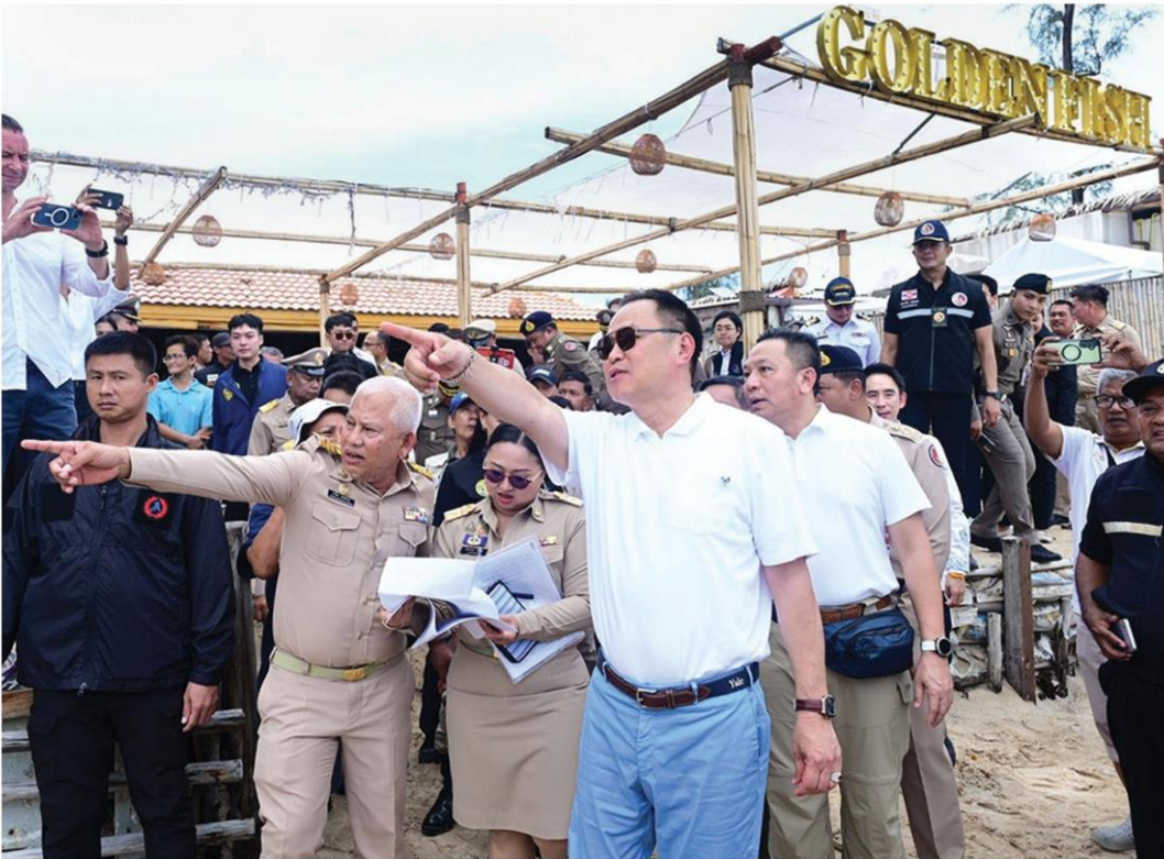
🏠 ตรวจภูเก็ต - นายอนุทิน ชาญวีรกูล นายกรัฐมนตรี ยกคณะไปติดตามการแก้ไขปัญหาทุกรุกพื้นที่สาธารณะหาดบางเทา ต.เชิงทะเล อ.ถลาง และหาดพริค้อม ต.ปะตอง อ.กะทู้ ภูเก็ต ประกาศต้องไม่มีมาเฟีย และภัยนักเลงคุกคามประชาชน เมื่อวันที่ 10 พ.ค.

ถ้ามีคนเหล่านี้เข้ามาในพื้นที่ให้แจ้งนายอำเภอ ตำรวจ หรือเจ้าหน้าที่ในพื้นที่ เชื่อว่า เมื่อตนได้มาถึงตรงนี้แล้ว จากนั้นไปถ้าใครปล่อยปละละเลย ยังมีคนโค่นล้มแห่งรังแกถูกข่มขู่คุกคาม เอาเป็นว่าก่อนที่ตนจะไป คนที่รับผิดชอบไปก่อนแน่นอน ตนจะใช้อำนาจหน้าที่ของตนอย่างเต็มที่ใน