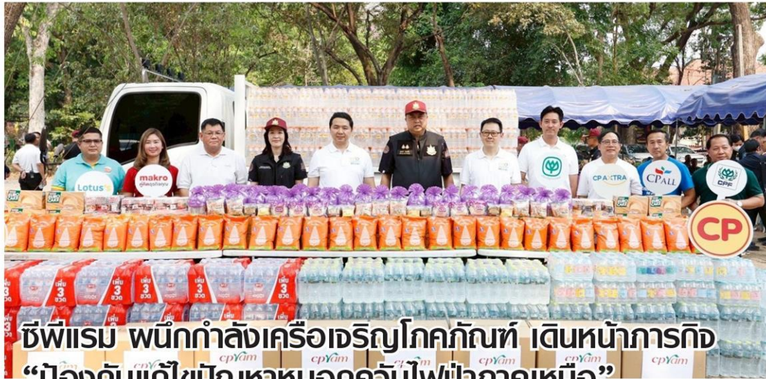
ซีพีแรม ผนึกกำลังเครือเจริญโภคภัณฑ์ เดินหน้าภารกิจ “ป้องกันแก้ไขปัญหาหมอกควันไฟป่าภาคเหนือ”