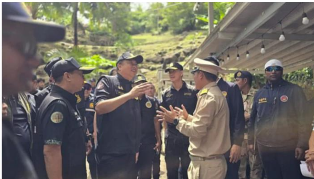
“สุชาติ” สั่งเข้ม ดำเนินคดี “หาคัญญ์” ภูเก็ต ยึดเพิ่มอีก 15 ไร่ นายทุนรุกพื้นที่