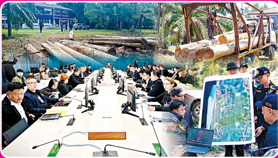
▲ เร่งคดี...นายชีวะภาพ ชีวะธรรม สว.เจ้าหน้าที่หน่วยงานรัฐเร่งรัดคดีบุกรุกป่าเขาปากเตรียม จ.ระนอง และกรมอุทยานแห่งชาติใช้สิรินาทโมเดลเชื่อไม่รอเพิกถอนที่ดิน ด้านชุดพักชีพพรระดมเก็บหลักฐานต่อเนื่อง

แนะอุทยานฯ พักชีพพร ลุยแจ้ง ยึดหลักการ ข้อหากราวรด ชนวน สิรินาทโมเดล เตรียม การเขมือบป่าเขาปาก