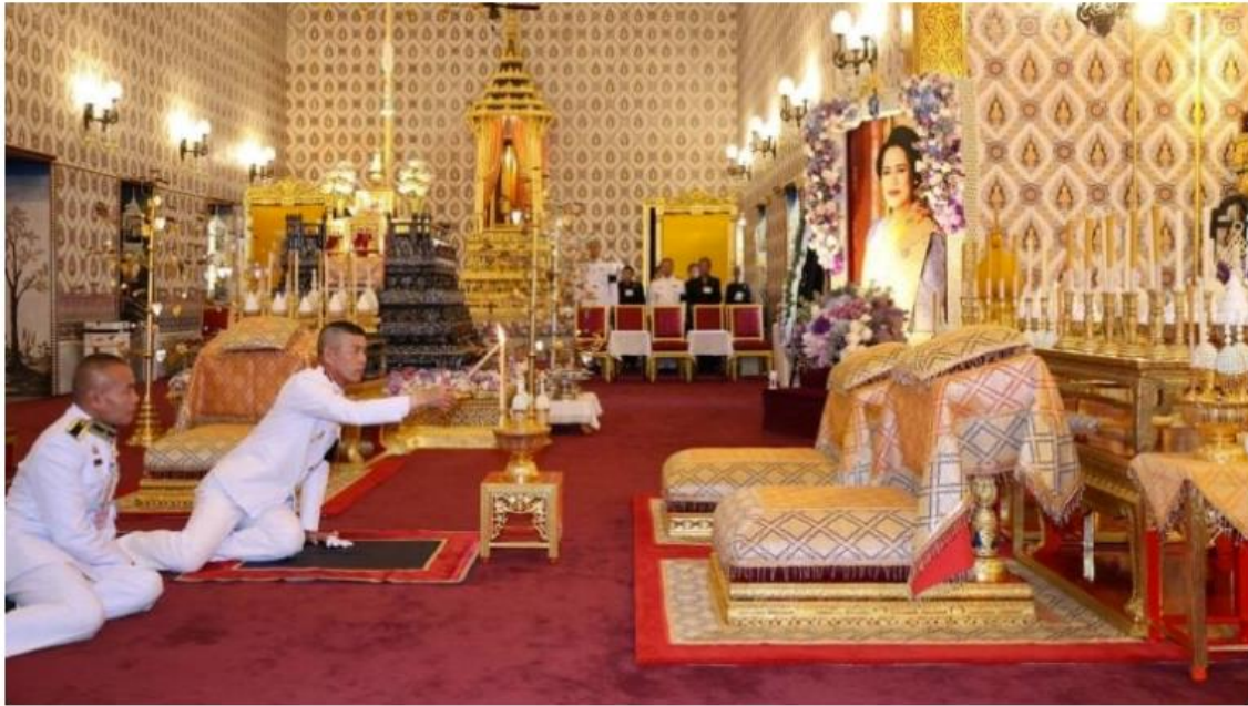
คณะบุคคลบำเพ็ญกุศลอุทิศถวายพระบรมศพ สมเด็จพระนางเจ้าสิริกิติ์ พระบรมราชินีนาถ พระบรมราชชนนีพันปีหลวง

วันที่ 29 เม.ย. 69 เวลา 10.00 น. กองพลทหารราบที่ 11 มหาวิทยาลัยราชภัฏสวนสุนันทา มหาวิทยาลัยทักษิณ ศาลเยาวชนและครอบครัวจังหวัดฉะเชิงเทรา ได้รับพระราชทานพระบรมราชานุญาตให้เป็นเจ้าภาพบำเพ็ญกุศล และพระพิธีธรรมสวดพระอภิธรรมพระบรมศพ สมเด็จพระนางเจ้าสิริกิติ์ พระบรมราชินีนาถ พระบรมราชชนนีพันปีหลวง ณ พระที่นั่งดุสิตมหาปราสาท ในพระบรมมหาราชวัง ในการถวายภัตตาหารเพลแด่พระสงฆ์จากวัดประดู่ฉิมพลี วัดราชสิทธาราม วัดเทพศิลา กรุงเทพมหานคร วัดมหาวนาราม จ.อุบลราชธานี วัดเสาชิงช้า จ.นนทบุรี วัดพระพุทธบาทชนแดน จ.เพชรบูรณ์ ที่สวดพระพุทธมนต์