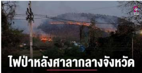
ไฟป่าหลังศาลากลางจังหวัด