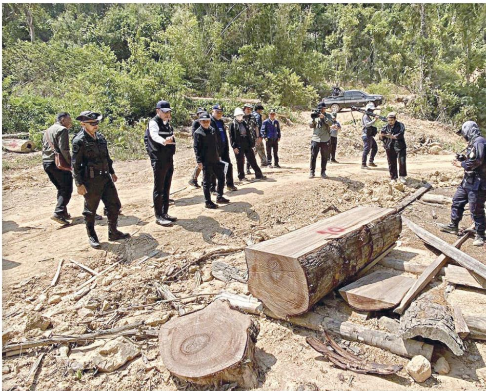
▲ เปิดโปง...จนท.ลงพื้นที่เขาปากเตรียม ต.กำพวน อ.สุขสำราญ จ.ระนอง หลังถูกตีแผ่ถูกบุกรุกพื้นที่ป่าและ ออกเอกสารสิทธิ น.ส.3 ก. โดยมีชอบ ก่อนหน้านั้นเคยถูกเสนอให้หน่วยงานเกี่ยวข้องเพิกถอนแต่เรื่องเงียบ

เชื่อกุณอิทธิพลใหญ่ ตั้งดีเอสไอร่วมตรวจ “สุชาติ” สั่งระดมทีม ชุดพยัคฆ์ไพร-พญาเสือ ลุยสวนปมร้อน “น.ส.3 ก.” โผล่ ♦อ่านต่อหน้า 2