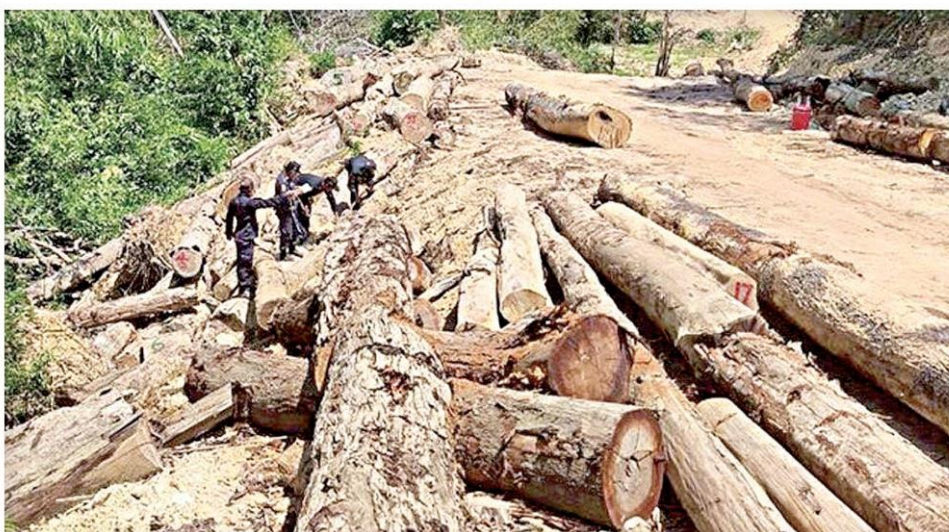
▲ ตรวจจรุกป่า... จนท.ตรวจสอบพื้นที่เขาปากเตรียม ต.กำพวน อ.สุขสำราญ จ.ระนอง ที่กำลังมีปัญหา นายทุนใหญ่สุบผืนป่ากว่า 2 พันไร่ โดยอ้างมีเอกสารสิทธิ น.ส.3ก. เบื้องต้นพบตัดไม้กองไว้จำนวนมาก

เจ้าของที่ดิน ประกอบด้วย กลุ่มบริษัท เอกชนจำนวน 3 บริษัท รวม 33 แปลง และกลุ่มบุคคลธรรมดาอีก 72 แปลง ซึ่ง มีทั้งเป็นการออกเฉพาะรายที่สืบเนื่องมา จากหลักฐานแบบแจ้งการครอบครองที่ดิน ส.ค. 1 จำนวน 46 แปลง แต่พบหนังสือ รับรองการทำประโยชน์ น.ส.3 ก. ที่ออก