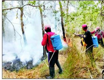
ฝุ่นควัน-ไฟป่า วิกฤตเรื้อรัง