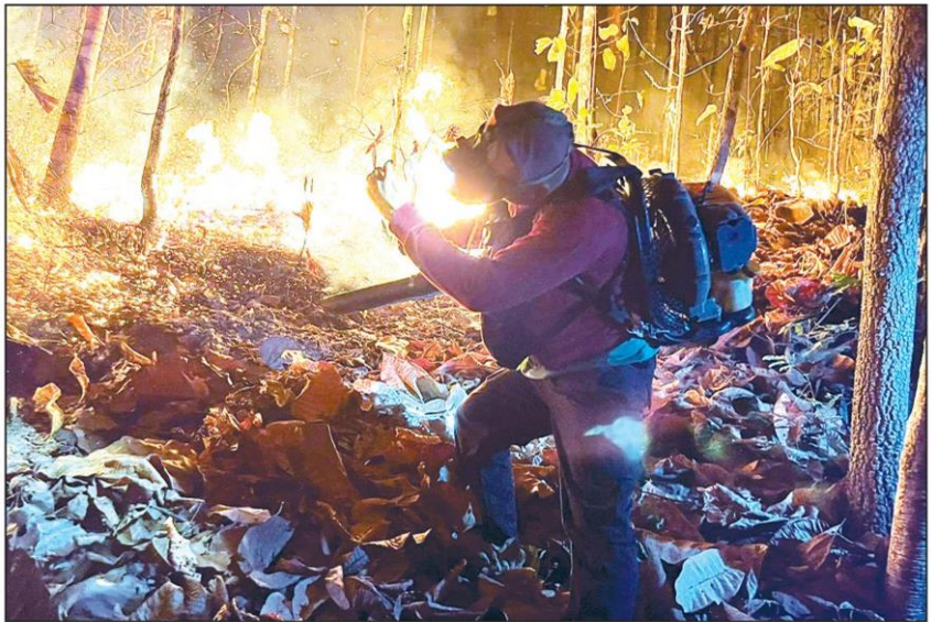
▲ ดับไฟป่า : เจ้าหน้าที่ผจญเพลิง กำลังดับไฟป่าที่ลุกไหม้ต่อเนื่องเป็นเวลากว่า 1 สัปดาห์ในพื้นที่ อ.ปาย จ.แม่ฮ่องสอน โดยต้องทำงานอย่างหนัก 24 ชั่วโมง เพื่อป้องกันไม่ให้ไฟป่าลุกลามเข้าสู่บ้านเรือนราษฎร

ทั้งร้อน ทั้งฝุ่น! กรมอุตฯ เตือน บางพื้นที่ร้อนจัด ทะลุ 42 องศา ฝุ่น PM2.5 เกินเกณฑ์ ขอประช. ดูแลสุขภาพ ด้านแม่ฮ่องสอน สถานการณ์ไฟป่ายังคงหนักหน่วง ▶▶▶ ต่อ : เตือนภัย - หน้า 9