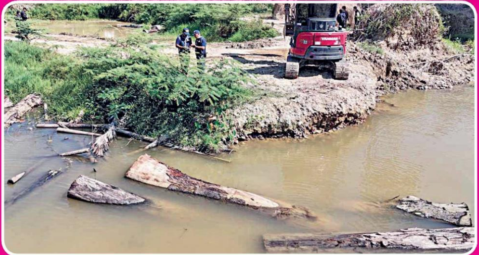
▲ ซุงซุกบ่อน้ำ...ตร.บก.ปทส.บุกตรวจสอบสวนปาล์มหมักมันเนื้อที่ประมาณ 500 ไร่ ต.กะเปอร์ อ.กะเปอร์ จ.ระนอง พบท่อนซุงซุกบ่อน้ำในบ่อน้ำเกือบ 40 ท่อน อาจโยงคตีป่าเขาปากเตรียมในพื้นที่ น.ส.3 ก. โดยมีขอบ

ผงะเจอบึงเกือบ 40 ท่อนซุกบ่อน้ำ หลังทีมไซคลิตีป่าเขาปากเตรียมลงพื้นที่ บุกค้นสวนปาล์ม 500 ไร่ “บึกเต่า” กัดไม้ปล่อย ฟันมีอติ “ปทส.-ปปป.” กวาดล้างให้สิ้นซาก สางคดีชบวนการเขมือบบ่า ◆อ่านต่อหน้า 10