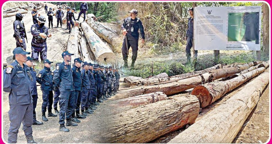
▲ ประเด็นแจ้งจับ...จนท.ลงพื้นที่ตรวจไม้ซุงเดือนที่ยึดจากป่าเขาปากเตรียม จ.ระนอง ขณะชุดพัยคัมไพร์หอบหลักฐานชุดใหญ่ประเด็นแจ้งความร้องทุกข์ที่กองบัญชาการตำรวจสอบสวนกลาง (บช.ก.)

“พัยคัมไพร์” หอบ หลักฐานชุดใหญ่ ปม ฉาว “น.ส.ร.ก.” รุกป่า เขาปากเตรียม จ.ระนอง ประเด็นแจ้งความร้อง ทุกข์ ◆ อ่านต่อหน้า 10