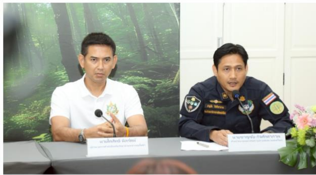
กรมป่าไม้ แจงไม่ตรวจสอบ “วัดป่าบ่อน้ำพระอินทร์” ยันไร้กลิ่นแก๊ส

“ ย้ำว่าไม่มีการแจ้งความดำเนินคดีกับหลวงตาพระสันคิด พระสงฆ์ แม่ชี หรือลูกศิษย์ รวมทั้งไม่สั่งหรือขับไล่ให้ใครออกจากพื้นที่ ในพื้นที่ดังกล่าวยังคงสามารถใช้ประโยชน์ และร่วมกันดูแลตามโครงการพระสงฆ์ช่วยงานป่าไม้ได้ปกติ ”