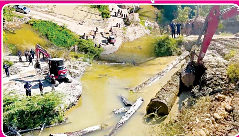
▲ สิ่งอ้ายด่...ชุดพยนต์ม์ไพโรร่วมกับ ตร.ปทส. ลุยอ้ายด่ไม่ซุง 39 ท่อน หลังตรวจเจอในบ่อน้ำใหญ่ ไถล่เขาปากเตรียม อ.สุขสำราญ จ.ระนอง ลั่นจะไล่สอบขยายผล เพื่อสาวไปให้ถึงขบวนการทั้งหมด