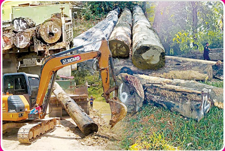
▲ สั่งอายัด... ชุดพยัคฆ์ไพร่ ร่วมกับ ตร.ปทส. เคลื่อนย้ายซุงใหญ่ 42 ท่อน ที่ซุกไว้ในบ่อน้ำใหญ่ ใกล้ เขาปากเตรียม จ.ระนอง ไปเก็บไว้ โดยจัดกำลังดูแลอย่างเข้มงวด เพื่อรอเจ้าหน้าที่เอกสารมาแสดง

แฉอีก “กลุ่มนาย ทุน” เขมือบเขาปาก เตรียม จ.ระนอง เคย พยายามจะไปสูบพื้นที่ สาธารณะ “ทุ่งหนอง ใหญ่” ใจกลางเมือง ชุมพร แต่ชุดเฉพาะ กิจฯ กอ.รมน.ภาค 4 พร้อม ◆อ่านต่อหน้า 2