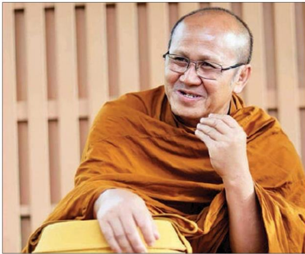
พระสุนทรพิชัย จรณธัมโม หรือ "หลวงตาสันคิด"

จะเดินทางไปยังวัดป่าบ่อน้ำพระอินทร์ แล้วจะไลฟ์สดตำกรมป่าไม้ ที่นั่น