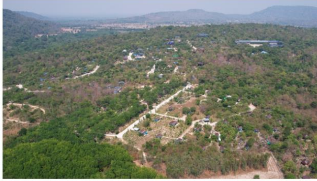
กรมป่าไม้ แจงปมตรวจสอบ "วัดป่าอู่น้ำพระอินทร์" ยันไร้กลิ่นแก๊ส

กรมป่าไม้ วางแนวทางการดำเนินงานการแก้ไขปัญหา โดยมอบหมายให้สำนักจัดการป่าชุมชน ลงพื้นที่ร่วมกับหน่วยงานที่เกี่ยวข้อง เพื่อทำความเข้าใจกับทางวัด และจัดเจ้าหน้าที่เข้าไปถวายความรู้แต่พระสงฆ์ เกี่ยวกับแนวทางการปฏิบัติในเขตป่าสงวนแห่งชาติ เพื่อให้ "ธรรมะและธรรมชาติ" อยู่ร่วมกันได้อย่างกลมกลืนและยั่งยืน พร้อมย้ำว่าการดำเนินการทุกขั้นตอนเป็นไปตามหลักกฎหมาย และยึดถือประโยชน์ของทรัพยากรธรรมชาติเป็นสำคัญ โดยพร้อมให้ความเป็นธรรมกับทุกฝ่าย