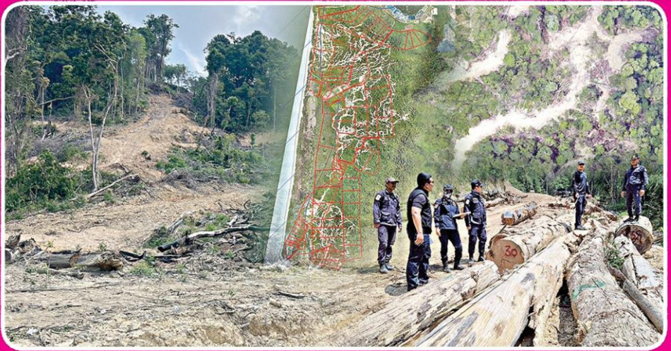
▲ ลุยป่า...ชุดพยนต์ม์ไพร์ กรมป่าไม้ ปักหลักเขาปากเตรียม จ.ระนอง นำเครื่อง UAV ขึ้นบินตรวจสอบแกนป่า ตะลึงพบไม้ซุงซุกบนยอดเขาอีกเพียบกว่า 10 จุด นับพันท่อน ผืนป่าเสียหายยับเยิน

ชุด "พยนต์ม์ไพร์" นำ UAV ขึ้นบินตรวจสอบแกนป่าเขาปากเตรียมระนอง ตะลึง! พบไม้ซุงซุกบนยอดเขาอีกเพียบกว่า 10 จุด