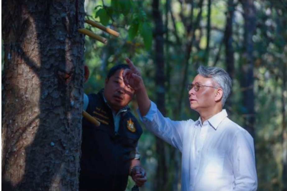
สถาบันส่งเสริมศิลปหัตถกรรมไทย (SACIT) พนักกำลังกรมป่าไม้ ร.ก.ส. ผลักดันและสร้างแรงจูงใจในการปลูกต้นไม้รัก เพื่อพัฒนาวัตถุดิบต้นทาง