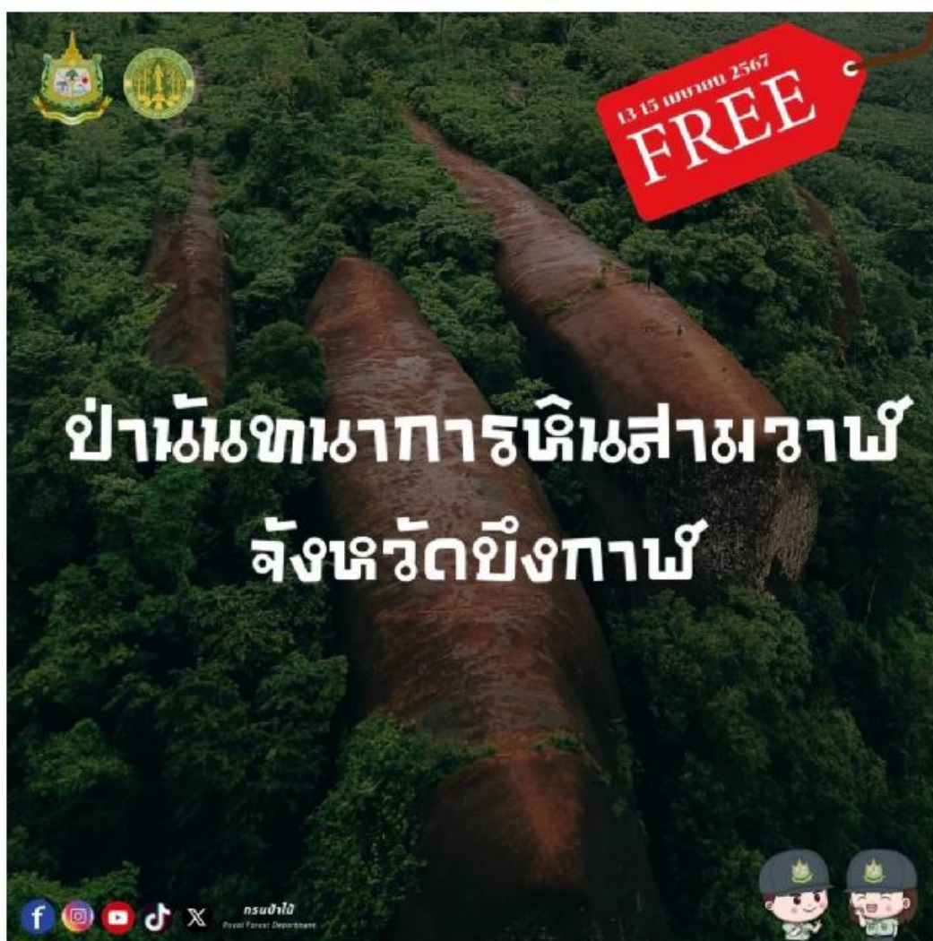
ป่าันทนาการหินสามวาฬ จังหวัดบึงกาฬ

โดยพื้นที่ป่าันทนาการทั้ง 3 แห่ง จัดเป็นแหล่งท่องเที่ยวทางธรรมชาติที่ได้รับความนิยมจากประชาชนและนักท่องเที่ยวทั้งในประเทศและต่างประเทศอย่างต่อเนื่อง ดังนั้นการยกเว้นค่าบริการในพื้นที่ป่าันทนาการทั้ง 3 แห่งนี้ จึงถือเป็นการส่งเสริมการท่องเที่ยวในพื้นที่ให้ขยายตัวเพิ่มขึ้น และนับเป็นอีกหนึ่งการบริการที่ช่วยส่งเสริมการศึกษาเรียนรู้ทางธรรมชาติให้แก่ประชาชนควบคู่ไปกับการพักผ่อนหย่อนใจในพื้นที่ป่าันทนาการได้อย่างเต็มที่