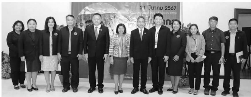
วันป่าไม้ - นายเฉลิมศักดิ์ เพ็ชรสุวรรณ รองปลัดทส. แถลงการจัดกิจกรรมเนื่องในวันป่าไม้สากล ปี 67 (International Day of Forests 2024)” วันที่ 21 มี.ค. ที่เขื่อนวชิราลงกรณ์ อ.ทองผาภูมิ จ.กาญจนบุรี เฉลิมฉลองวันป่าไม้สากล ที่ทส.

วันป่าไม้สากล ซึ่งตรงกับวันที่ 21 มี.ค. ของทุกปี ปีนี้สมัชชาใหญ่แห่งองค์การสหประชาชาติ กำหนดให้มีการรณรงค์ภายใต้ประเด็นหลัก “Forests and Innovation” หรือ “ป่าไม้และนวัตกรรม” และมีประเด็นเสริม “New solutions for a better world” หรือ “ทางเลือกใหม่ เพื่อโลกที่ดีขึ้น” เป็นวาระสำคัญ โดยมี พล.ต.อ.พัชรวาท วงษ์สุวรรณ รมว.ทส.เป็นประธานพิธีเปิดงาน