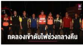
ทดลองเข้าดับไฟช่วงกลางคืน