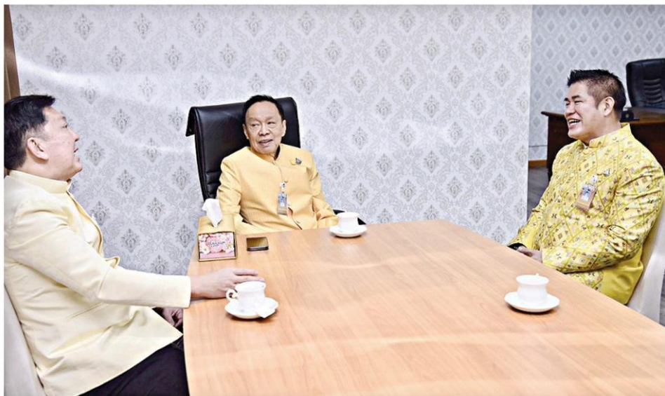
▲เคลียร์ใจ...พล.ต.อ.พัชรวาท วงษ์สุวรรณ รองนายกรัฐมนตรีและรมว.ทรัพยากรธรรมชาติและสิ่งแวดล้อม ร.อ.ธรรมนัส พรหมเผ่า รมว.เกษตรฯ ทหารี่ปมหมุด ส.ป.ก.เขาใหญ่ ก่อนได้ข้อสรุปให้กรมแผนที่ทหารชี้ขาด

เขาใหญ่ บริเวณบ้านห้วยปลากั้ง หมู่ 10 ต.หมูสี อ.ปากช่อง จ.นครราชสีมา จนเกิดข้อพิพาทระหว่าง กรมอุทยานฯ กับ ส.ป.ก. ว่าใครเป็นเจ้าของพื้นที่ดังกล่าว ก่อนเจ้าหน้าที่กรมแผนที่ทหารจะได้ลงพื้นที่เพื่อตรวจสอบว่าแนวเขตเจ้าปัญหาเป็นของใครกันแน่ตามที่เสนอข่าวไปแล้วนั้น เกี่ยวกับความคืบหน้าในเรื่องดังกล่าว เมื่อวันที่ 20