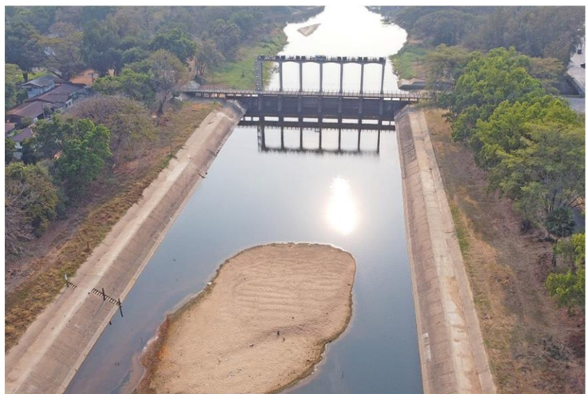
สันดอนโผล่ - เจ้าหน้าที่ปิดประตูระบายน้ำเพื่อสำรองน้ำให้ประชาชนได้ใช้ ส่งผลให้บริเวณหน้าประตูเขื่อนที่ปล่อยน้ำลงสู่ลำน้ำมูลระดับน้ำเหลือน้อย บางจุดเห็นสันดอนดินทรายโผล่ขึ้นเป็นบริเวณกว้าง ที่โครงการศูนย์ส่งน้ำและบำรุงรักษาทุ่งสัมฤทธิ์ ต.ในเมือง อ.พิมาย จ.นครราชสีมา เมื่อวันที่ 4 กุมภาพันธ์

กระทรวงมหาดไทยเน้นย้ำทุกจังหวัดให้ความสำคัญกับการประชาสัมพันธ์สร้างความรับรู้ให้กับประชาชนและภาคส่วนต่างๆ ให้มีความเข้าใจถึงสถานการณ์น้ำในพื้นที่ของตนเอง ทราบถึงมาตรการบริหารจัดการน้ำของภาครัฐ เพื่อให้เกิดความเข้าใจร่วมกันจนเกิดความ