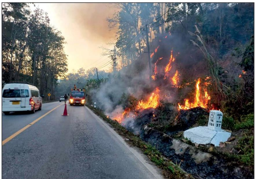
▲ ไฟป่าลาม : สถานการณ์ไฟป่าในพื้นที่ อ.ปาย จ.แม่ฮ่องสอน ยังคงน่าเป็นห่วง โดยพบจุดความร้อนถึง 35 จุด มีหลายพื้นที่เกิดไฟป่าลุกลาม ทำให้ต้องเร่งระดมกำลังเจ้าหน้าที่จากจังหวัดใกล้เคียง ลงพื้นที่ระงับไฟป่า

ผู้สื่อข่าวรายงานว่าที่อุทยานแห่งชาติพุเตย อยู่ในพื้นที่ อ.ด่านช้าง จ.สุพรรณบุรี มีพื้นที่รอยต่อติดกับ อ.บ้านไร่ จ.อุทัยธานี และ อ.เลาขวัญ จ.กาญจนบุรี ซึ่งช่วงนี้เกิดไฟป่าในพื้นที่เนื่องจากสภาพอากาศแห้งแล้งทำให้เจ้าหน้าที่พร้อมด้วยอาสาสมัครต้องเร่งช่วยกันทำแนวกันไฟกันอย่างไม่หยุดหย่อน แต่มีอุปสรรคที่ทำให้เจ้าหน้าที่