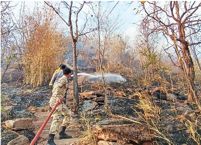
☐ ดับไฟป่า - จนท.ระดมดับไฟป่าด้านหลังวัดป่าหามะค่า หมู่บ้านมะค่า ต.โคกกระชาย อ.ครบุรี จ.นครราชสีมา คาดเกิดจากคนไปหาของป่าแล้วจุดไฟจมนรกลาม เมื่อ 13 ก.พ.

133.4 ไมโครกรัมต่อลูกบาศก์เมตร (มกก./ลบ.ม.) รองลงมา จ.สมุทรสาคร 126.4 มกก. จ.ราชบุรี 105.3 มกก. จ.นครปฐม 100.1 มกก. จ.เพชรบุรี 99.3 มกก. โดย 24 จังหวัด พบค่าฝุ่นในระดับสีแดง ส่วนอีก 31 จังหวัดที่ยังคงมีคุณภาพที่เริ่มมีผลกระทบต่อสุขภาพ และหลายพื้นที่คุณภาพอากาศที่ยังคงอยู่ในระดับสีส้มต่อเนื่อง โดยเฉพาะภาคตะวันออกเฉียงเหนือ