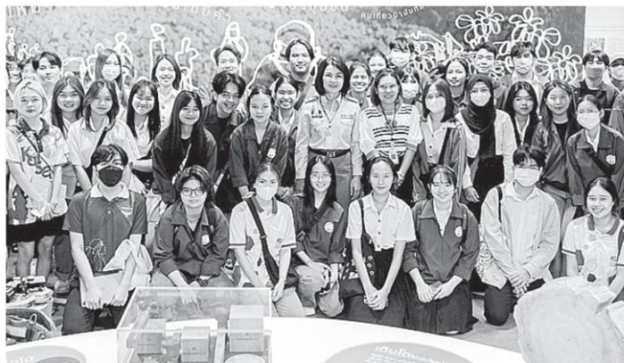
นิสิตชั้นปีที่ 1 คณะวนศาสตร์ มหาวิทยาลัยเกษตรศาสตร์ ศึกษา ดูงานเพื่อหาความรู้เกี่ยวกับการกึ่งหน้าที่ การปฏิบัติงานของกรมป่าไม้ พร้อม เยี่ยมชมประวัติความเป็นมาตั้งแต่เริ่มสถาปนากกรมป่าไม้จนถึงปัจจุบัน ณ พิพิธภัณฑ์ กรมป่าไม้ ชั้น 1 อาคารเทียมคมกฤต.