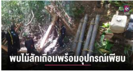
พบไม้สักเกือบพร้อมอุปกรณ์เพียง