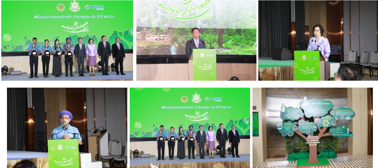
พลังงาน / สิ่งแวดล้อมย้อนกลับ