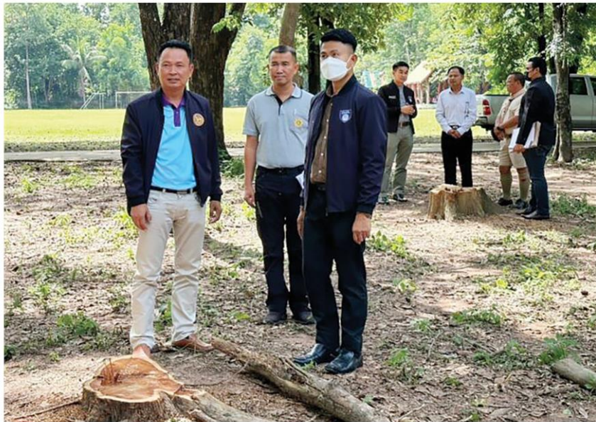
คดีไม้พะยูนง - เจ้าหน้าที่ป.ป.ท.เขต 4 ขอนแก่น และเจ้าหน้าที่ศูนย์ปฏิบัติการคดีพิเศษ (ดีเอสไอ) เขตพื้นที่ 4 จ.ขอนแก่น เข้าตรวจสอบคดีลักลอบตัดไม้พะยูนงในพื้นที่ ต.อิตี้อ อ.ยางตลาด จ.กาฬสินธุ์ เมื่อวันที่ 26 ก.ย.

“ข้อมูลที่ได้ทั้งหมด ทั้งในส่วนของผู้ที่ชุดเฉพาะกิจตรวจสอบข้อเท็จจริง และคณะกรรมการตรวจสอบเชิงลึก กรณีตัดไม้พะยูนงในโรงเรียน รวมทั้ง ป.ป.ท.-ดีเอสไอ และ ป.ป.ช. ก็จะได้ประมวลผล และสรุปเนื้อหาสาระ นำเสนอต่อ ครม. เพื่อแก้ไขปรับปรุง การใช้ช่องว่างทางกฎหมาย ให้มีความรัดกุม สมบูรณ์มากยิ่งขึ้น ป้องกันทรัพยากรป่าไม้ให้อยู่คู่ประเทศชาติ รวมทั้งยังเป็นการป้องปรามการใช้อำนาจหน้าที่มิชอบของส่วนราชการ ยืนยัน ทุกฝ่ายทำงานกันอย่างเต็มที่ ไม่มีใครใส่เกี้ยว และไม่มีมายลัมแน่นอน” ผวจ.กาฬสินธุ์กล่าว