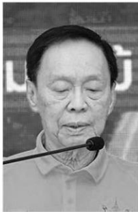
พล.ต.อ.พิชชราช วงษ์สุวรรณ

คณะรัฐมนตรี (ครม.) ได้มีมติเมื่อวันที่ 26 มิถุนายน 2533 ให้วันที่ 21 ตุลาคมของทุกปี ซึ่งเป็นวันคล้ายวันพระราชสมภพของสมเด็จพระศรีนครินทราบรมราชชนนี เป็นวันบำรุงรักษาต้นไม้ประจำปีของชาติ ต่อมา ครม. ได้มีมติเมื่อวันที่ 15 ตุลาคม 2533 ให้ใช้ชื่อว่า "วันรักต้นไม้ประจำปีของชาติ" เพื่อให้ประชาชนได้น้อมรำลึกถึงพระมหากรุณาธิคุณในน้ำพระราชหฤทัย อันประเสริฐที่มีต่อประเทศชาติและพสกนิกรชาวไทย อีกทั้ง เพื่อน้อมเกล้าฯ ถวายเป็นราชสักการะแด่สมเด็จพระศรีนครินทราบรมราชชนนี ด้วยการร่วมกิจกรรมบำรุงรักษาต้นไม้ โดย