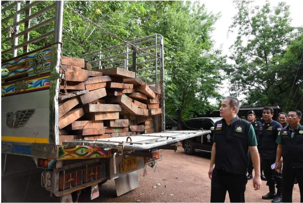
พิษณุโลก รองอธิบดีกรมป่าไม้ รุดตรวจของกลางไม้ประดู่แปรรูป 282 แผ่นเหลี่ยม 10 ล้อ 2 คัน