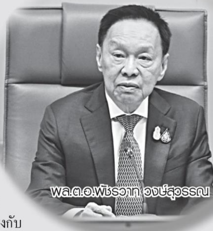
พล.ต.อ.พีรพงศ์ อภิสุธรรณ