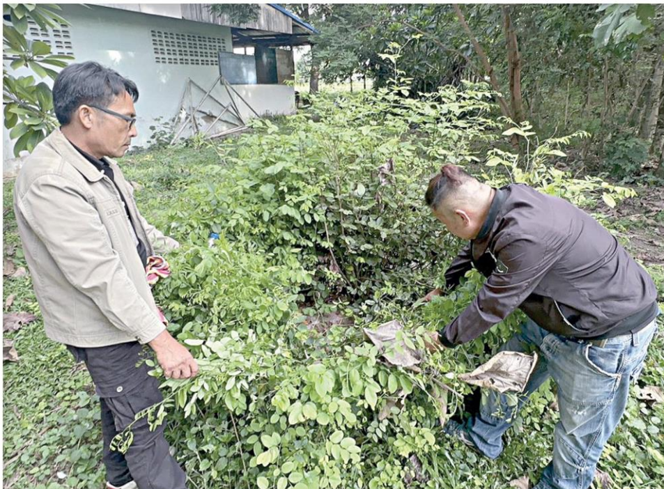
▲ตัดขายอีก...เจ้าหน้าที่ กอ.รมน.กาฬสินธุ์ ลงพื้นที่ตรวจสอบไม้พะยูนภายในโรงเรียนคุรุชนประสิทธิ์ศิลป์ ต.คำเหมือดแก้ว อ.ห้วยเม็ก จ.กาฬสินธุ์ หลังประชาชนร้องเรียนมีการอนุญาตให้ตัดขาย 3 ตัน 30,000 บาท

เมื่อวันที่ 31 ส.ค. ผู้สื่อข่าวรายงานว่า เจ้าหน้าที่ฝ่ายความมั่นคงและเจ้าหน้าที่ชุดรวบรวมและตรวจสอบข่าว กอ.รมน. กาฬสินธุ์ ลงพื้นที่ตรวจสอบในโรงเรียนคุรุชนประสิทธิ์ศิลป์ ต.คำเหมือดแก้ว อ.ห้วยเม็ก จ.กาฬสินธุ์ หลังมีตัวแทนภาคประชาชนในพื้นที่แจ้งเบาะแสว่า มีการตัดไม้พะยูนในโรงเรียนแห่งนี้ ใช้วิธีประมูลขายนำเงินเข้าแผ่นดินจำนวน 3 ตัน ขายให้กับพ่อค้าราคา 30,000 บาท โดยตัดขายไปตั้งแต่ต้นเดือน มี.ค. 2566 พฤติกรรมคล้ายกับโรงเรียนคำไฮวิทยา อ.หนองกุงศรี และโรงเรียนหนองโนวิทยาคม อ.ห้วยเม็ก จ.กาฬสินธุ์ โดยระบุสาเหตุว่าก่อนที่จะมีการซื้อขาย มีแก๊งมอได้ไม้เข้าไปลักตัดไม้