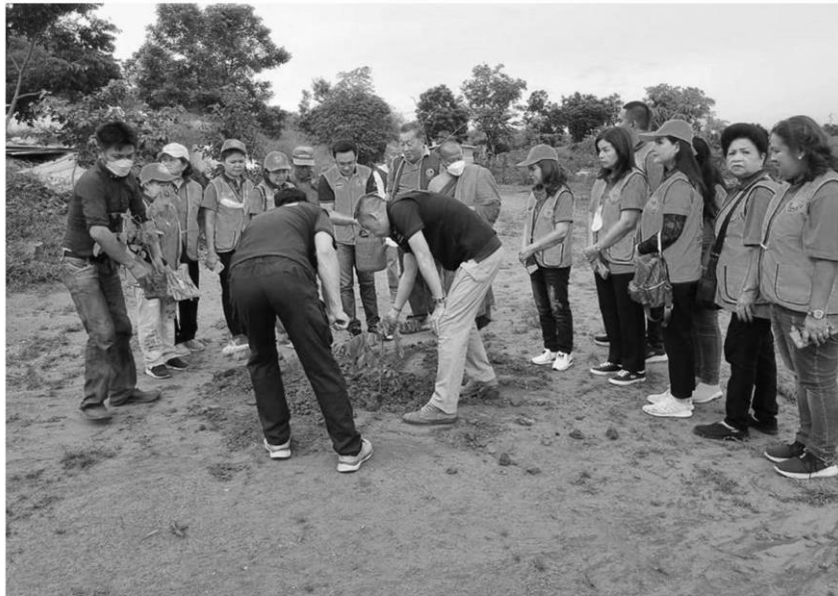
ปลูกล้า - สโมสรไลออนส์จังหวัดนครสวรรค์ร่วมกับสำนักจัดการทรัพยากรป่าไม้เขต 4 ปลูกล้าเฉลิมพระเกียรติ เนื่องในโอกาส “วันแม่แห่งชาติ” ณ ชุมชนบ้านหนองเนิน ตำบลหัวถนน อำเภอท่าตะโก จังหวัดนครสวรรค์ เนื้อที่ปลูก 2 ไร่