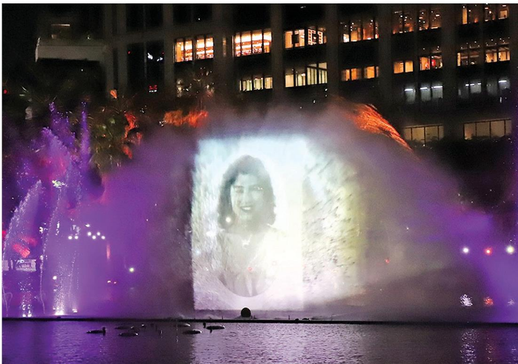
แม่แผ่นดิน - การแสดงม่านน้ำ 'แม่แห่งแผ่นดิน ผู้ทรงพระมหากรุณาธิคุณ' เฉลิมพระเกียรติสมเด็จพระนางเจ้าสิริกิติ์ พระบรมราชินีนาถ พระบรมราชชนนีพันปีหลวง เนื่องในโอกาสทรงเจริญพระชนมพรรษา 91 พรรษา ที่อุทยานเบญจสิริ ถ.สุขุมวิท การแสดงมีถึงวันที่ 31 ส.ค.