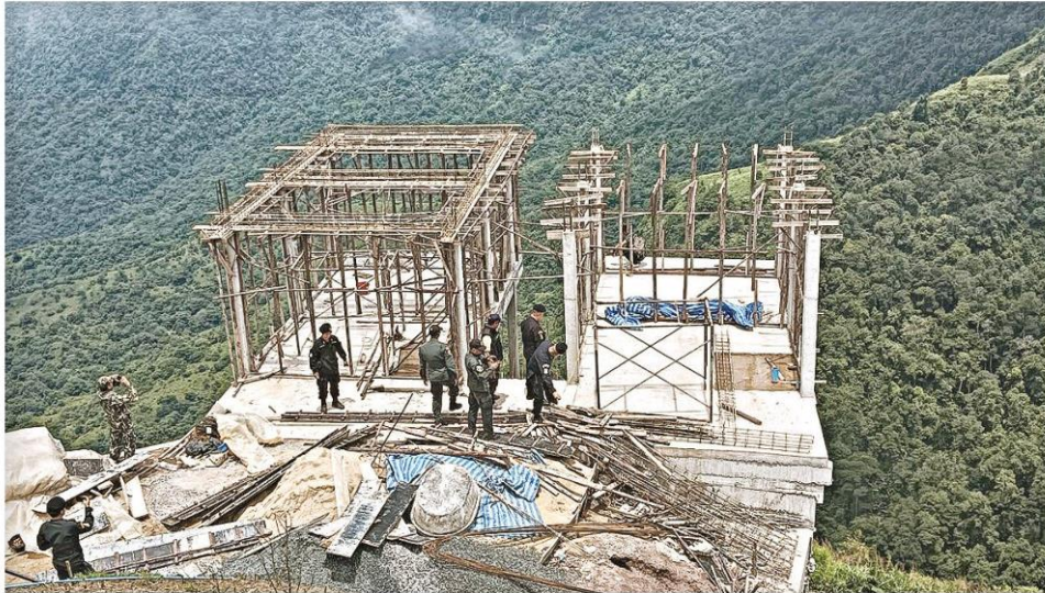
▲ รุกป่าสงวนฯ...ตร.บก.ปทส. สนธิกำลัง จนท.ป่าไม้ และ จนท.อุทยานแห่งชาติ บุกรุกยึดรีสอร์ต 2 แห่ง หลังพบheimบุกรุกป่าสงวนแห่งชาติ ในพื้นที่หมู่ 8 ต.บ้านเนิน อ.หล่มเก่า จ.เพชรบูรณ์ (ข่าวหน้า 13)