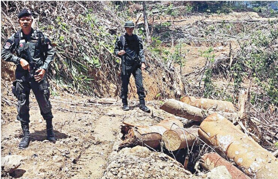
▲รุกป่า...ตชด.ภาค 4 สนธิกำลังร่วมกับ ตร.สภ.ธารโต จ.ยะลา และฝ่ายปกครอง ออกตรวจพื้นที่พบมีการบุกรุกป่าสงวนต้นน้ำนิคมสร้างตนเองธารโต บ้านไทยพัฒนา ต.คีรีเขต อ.ธารโต จ.ยะลา (ข่าวหน้า 6)