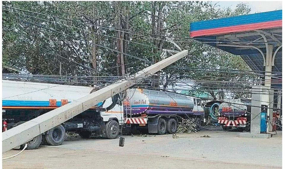
พายุถล่มเมือง ผลจากพายุฤดูร้อนที่พัดกระหน่ำหลายพื้นที่ใน อ.เมืองลพบุรี ทำให้เสาไฟฟ้าริมถนนคั่นคลอง ช่วงระหว่างเส้นทางบ้านโคกเกาะเทียม-บ้านหมี่ หักโค่น 52 ต้น ล้มทับทั้งบ้านและบิมน้ำมัน ส่งผลให้ไฟฟ้าดับหลายหมู่บ้าน.

ขณะที่ อ.เมืองลพบุรี หลังเจอพายุฤดูร้อนกระหน่ำนานเกือบ 30 นาที เมื่อเย็นวันที่ 29