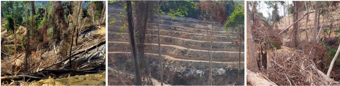
นายทุน ใช้รถแบ็คโฮ บุกรุกป่าสงวนแห่งชาติเขาวังพา