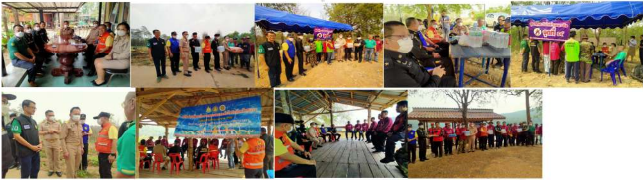
ผวจ.พะเยา ตรวจสอบป้องกันไฟฟ้าสำคัญย้ำเข้มงวดเต็มที่

Onbnews 11 เม.ย. 66 https://onbnews.today/post/91927