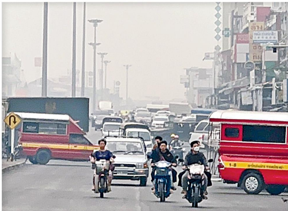
▲ หวนคืน... ฝุ่นพิษกลับมาวิกฤติอีกครั้งส่งผลให้ จ.เชียงราย เกิดหมอกควันและฝุ่นละอองปลิวว่อน ทั่วเมือง โดยคุณภาพอากาศอยู่ในระดับสีแดง ส่วนภาคเหนืออีก 19 จังหวัดอ่วมฝุ่นพิษปกคลุมเมือง

ภาคตะวันออกเฉียงเหนือ (อีสาน) ระหว่าง 34-84 มกก./ลบ.ม. เกินมาตรฐาน 3 พื้นที่ ได้แก่ ต.กุดป่อง อ.เมืองเลย, ต.โน เมือง อ.เมืองนครพนม และ ต.บึงกาฬ อ.เมืองบึงกาฬ สำหรับกรุงเทพฯและ ปริมณฑล ภาคกลาง ภาคตะวันออก และ ภาคใต้คุณภาพอากาศอยู่ในระดับดีมากถึง ปานกลาง กองจัดการคุณภาพอากาศและ