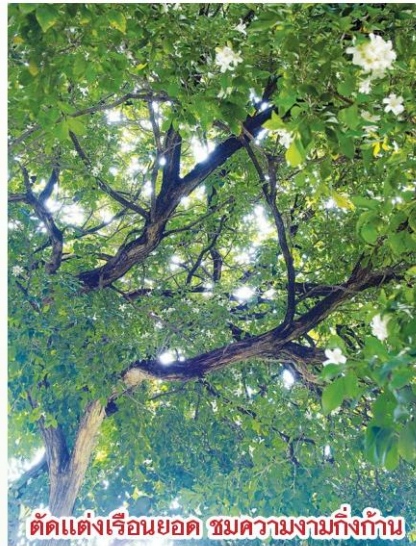
ตัดแต่งเรือนยอด ชมความงามกิ่งก้าน