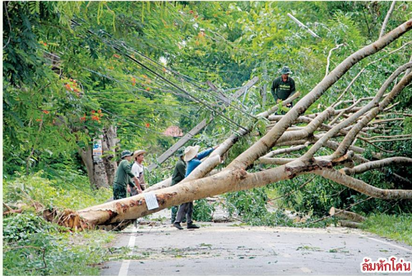
ล้มหักโค่น

ดร.คงศักดิ์เพิ่มเติมว่า รูปแบบการค้ายันขึ้นอยู่กับต้นไม้ อย่างเช่น ถ้าต้นไม้โน้มเอียงไปด้านใดด้านหนึ่ง จะค้ายันเพื่อไม่ให้ต้นไม้เอียงไปทางด้านนั้นมากขึ้น หรือถ้าในค้ายันนั้นไม่สามารถตั้งการค้ายันได้ จำเป็นจะต้องใช้การดึงกลับในฝั่งตรงข้ามที่โน้มเอียง