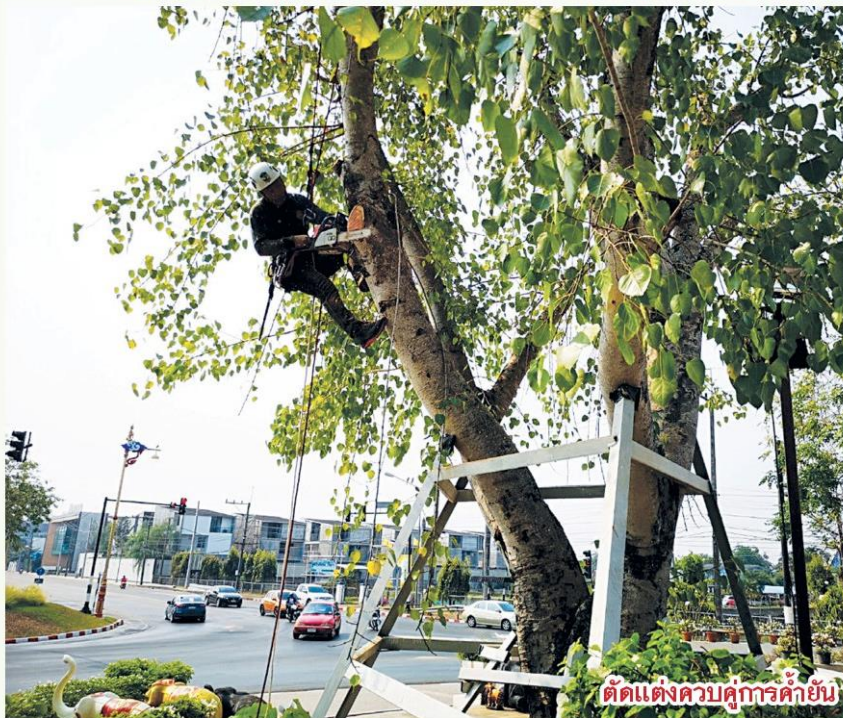
ตัดแต่งความค้ำยัน

โน้มออกไป โนมเฉียงไปเรื่อย ๆ จะเห็นว่า ต้นไม้หนีอาคาร ในที่สุด ขณะที่รากถูกบดบี้ รากชยายออกไม่เต็มที อีกทั้งรากต้นไม้สามารถ หยั่งลึกลงไปใต้ดิน เมื่อลมมาปะทะจึงล้มลง ดังที่กล่าวเหมือนเราฮิน ชาติ ฮินเฉียงอยู่แล้ว โอกาสล้มลงจึงมีมาก ซึ่งเช่นเดียวกับต้นไม้”