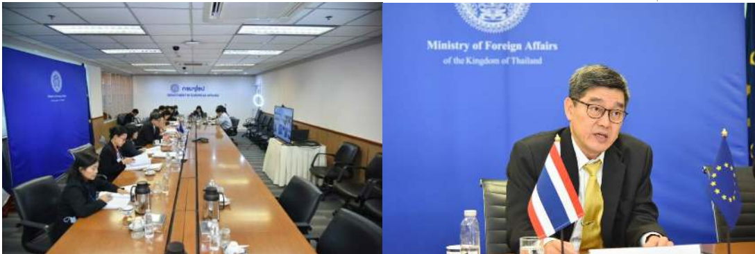
เผยแพร่ วันจันทร์ที่ 2 พฤศจิกายน พ.ศ.2563