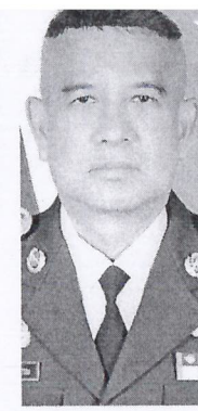
พล.อ.อ.แอร์บูล สุทธิวรรณ

ประมาณรายจ่ายปี 2564 ซึ่งสภาก็จะผ่านไป อีก มีเครื่องมือในการบริหารเศรษฐกิจและโควิดได้ทั้งหมด ดังนั้น เรื่องจัดการปัญหาโควิดและปัญหาเศรษฐกิจเป็นเรื่องของรัฐบาลล้วนๆ