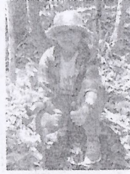
สิริวิภา สพรธรรณเส รองเลขาธิการ ก.ล.ต.

เรือนกระจก (องค์การมหาชน) และสำนักงานพัฒนาเทคโนโลยีอวกาศและภูมิสารสนเทศ (องค์การมหาชน) ซึ่งปัจจุบันมีป่าชุมชนนำร่องของโครงการ 17 ป่าชุมชน ครอบคลุมพื้นที่ 20,376 ไร่ ในเขต 4 จังหวัดภาคเหนือ ได้แก่ เชียงราย เชียงใหม่ พะเยา แม่ฮ่องสอน และมีชาวบ้านที่มีส่วนร่วมดูแลป่ากว่า 3,200 ครัวเรือน ทั้งนี้ เมื่อวันที่ 30 สิงหาคม 2563 ถือเป็นครั้งแรกที่สำนักงานคณะกรรมการกำกับ