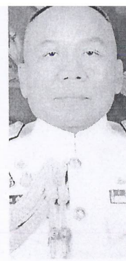
พล.ร.อ.ชาติชาย ศรีวีรชาน