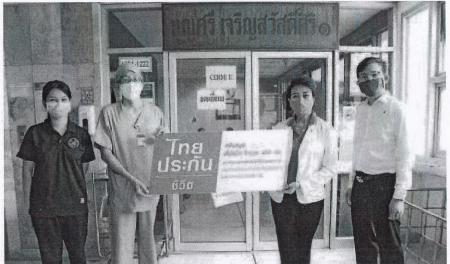
มอบเสื้อไปโลจำนวน 400 ตัว แก่คณะแพทยศาสตร์ ศิริราชพยาบาล

โสภณ ประธานเจ้าหน้าที่บริหารฝ่ายปฏิบัติการ บริษัท โคคา โสตตั้ง อินเทอร์เน็ต เซ็นแนล จำกัด ต่อยอดแนวคิดแชร์ความสุขคืนสู่มือคนไทย บัณฑิตโครงการ