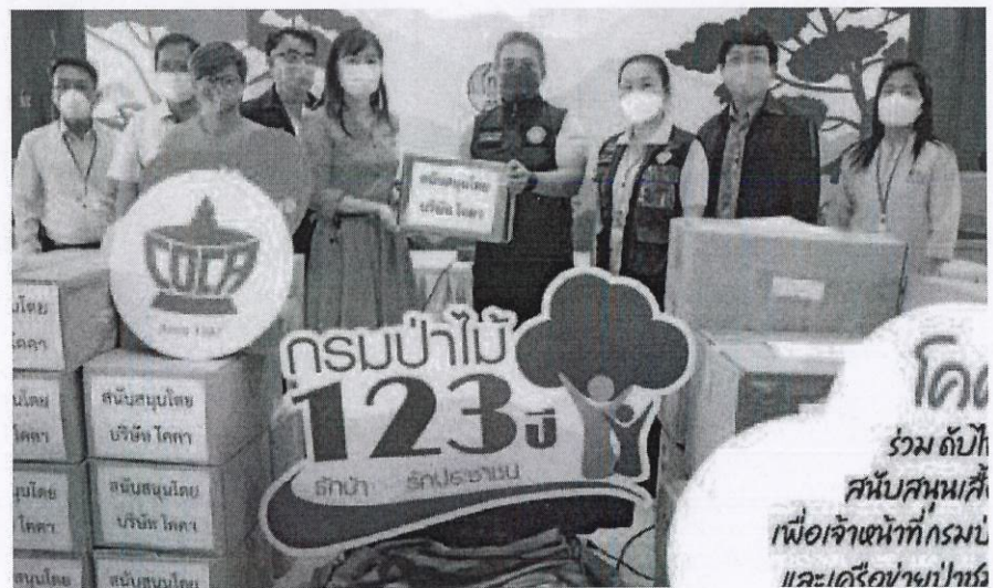
โคคา สุกี้ มอบชุดป้องกัน ดับไฟป่า ในโครงการ 'COCA Share'

COCA Share เป็น New Normal วัฒนธรรมใหม่องค์กร พร้อมเริ่มลงมือแชร์ความสุขสู่การแก้วิกฤต ใน โคคา ร่วมดับไฟป่า นำชุดเครื่องแบบพนักงานแบบเก่าที่ยังไม่ผ่านการใช้งาน มอบให้กับกรมป่าไม้