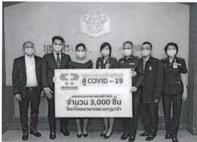
รองผู้อำนวยการโรงพยาบาลพระมงกุฎเกล้าฯ รับมอบเจลล้างมือแอลกอฮอล์