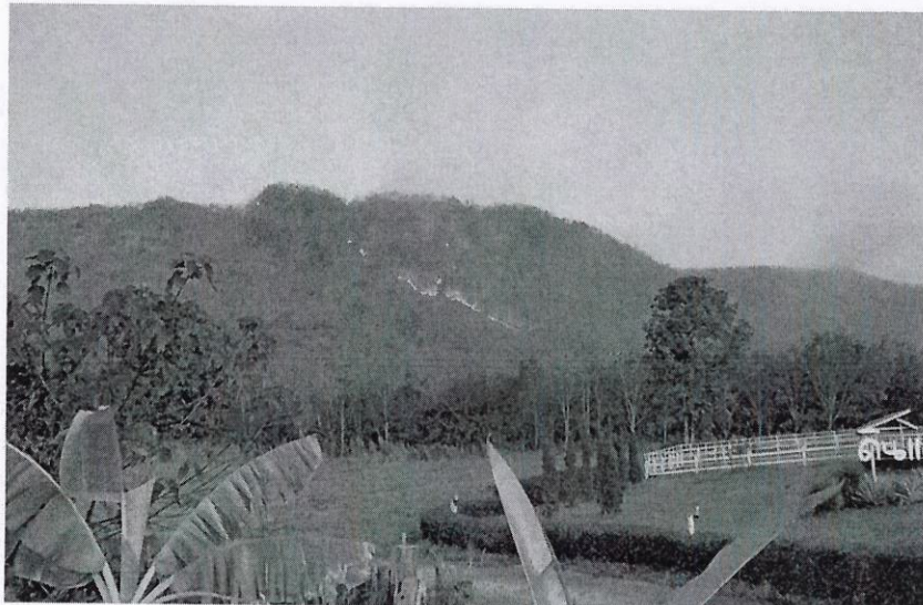
ไฟป่าภูสะนาว - เกิดไฟไหม้บริเวณแนวป่าภูสะนาว ในเขตป่าสงวนแห่งชาติ ป่าภูห้วยหมาก ต.ศรีสองรัก อ.เมืองเลย จ.เลย ไฟได้ไหม้ลามขึ้นหลายจุดบนภูสะนาว เนื่องจากเป็นภูเขาขนาดใหญ่ บางจุดไฟไหม้ป่าลุกลามเป็นแนวยาวกว่า 2 กิโลเมตร เมื่อวันที่ 2 มกราคม