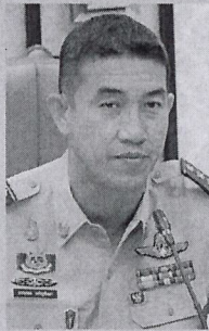
ธรรมาธิราช

วิทยาศาสตร์บัณฑิต (วนศาสตร์) มหาวิทยาลัยเกษตรศาสตร์ ปริญญาโทส่งเสริมการเกษตรและสหกรณ์ มหาวิทยาลัยสุโขทัย