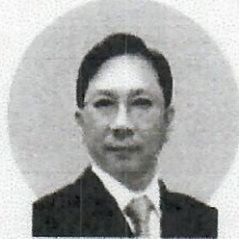
คุณชุลลิต สุรัสวดี ที่ปรึกษานายกรัฐมนตรี