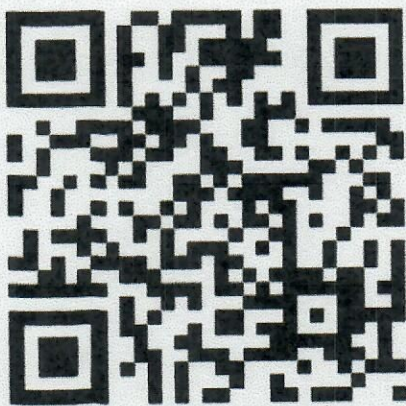
QR code รายละเอียดเพิ่มเติม

โดยดูรายละเอียดเพิ่มเติมเพื่อยื่นข้อเสนอได้ที่ : https://www.tcdc.or.th/th/all/events/2147