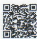
๒) รายละเอียดงาน