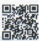
๑) ลงทะเบียน

กองยุทธศาสตร์และประสานการพัฒนาขีดความสามารถในการแข่งขัน โทร. ๐ ๒๒๘๐ ๔๐๘๕ ต่อ ๕๖๑๘ และ ๕๖๔๒ โทรสาร ๐ ๒๒๘๑ ๑๘๒๑