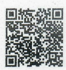
เอกสารฉบับที่ ๓