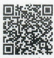
เอกสารฉบับที่ ๑