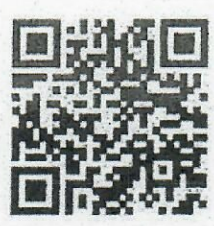
เอกสารฉบับที่ ๒