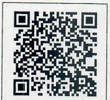
QR-Code เพื่อสอบถาม