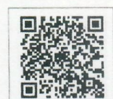
QR-Code เพื่อสอบถาม