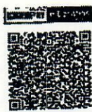
ร่วมทำบุญผ่านระบบ E - Donation

๑. ร่วมทำบุญ โดยใช้ Application ของธนาคารใดก็ได้ สแกนผ่านรหัส QR Code นี้ ซึ่งยอดเงินร่วมทำบุญจะถูกบันทึกในระบบ E - Donation ของกรมสรรพากรโดยอัตโนมัติ ในรายการลดหย่อนภาษี (กรณีนี้ไม่จำเป็นต้องออกใบอนุโมทนาบัตร)