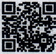
ใบอนุญาตเงิน