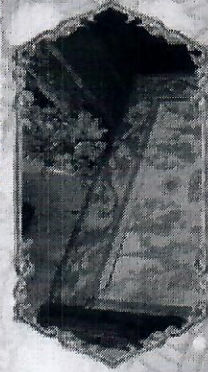
หน้าศาลเจ้ากรุง