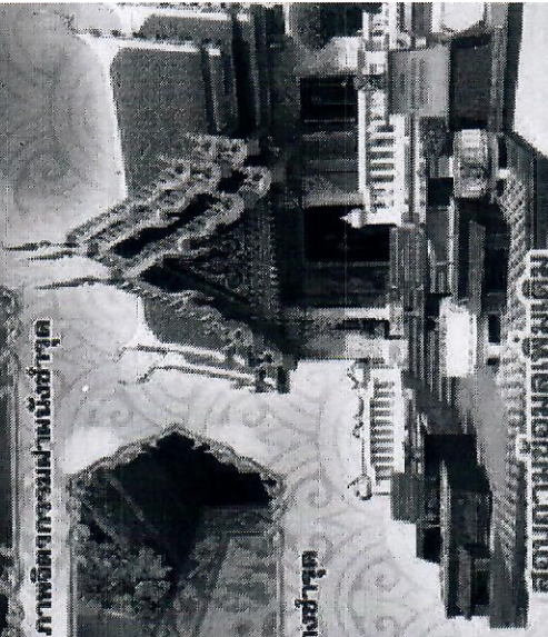
สอบถามข้อมูลเพิ่มเติม